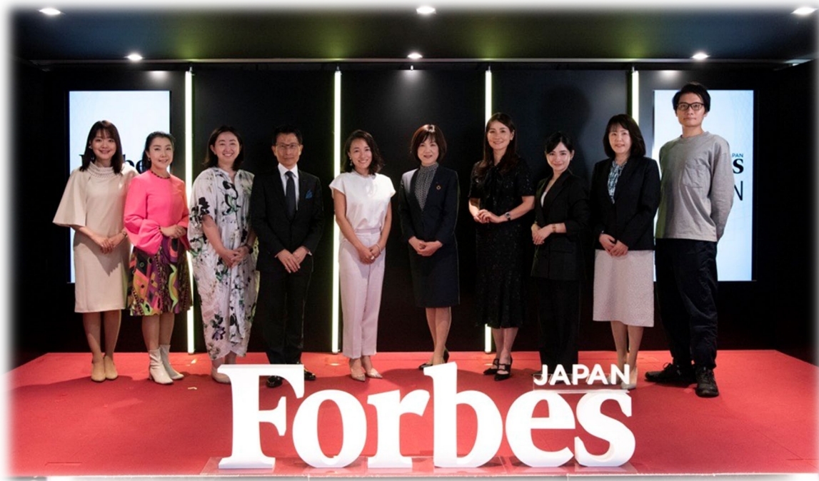
授賞式の様子(2024年9月)

Forbes JAPAN WOMEN AWARD 2024 ～企業特別賞「ポジティブアクション賞」を受賞～