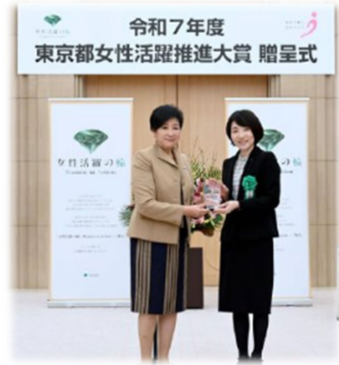
授賞式の様子(2026年1月)